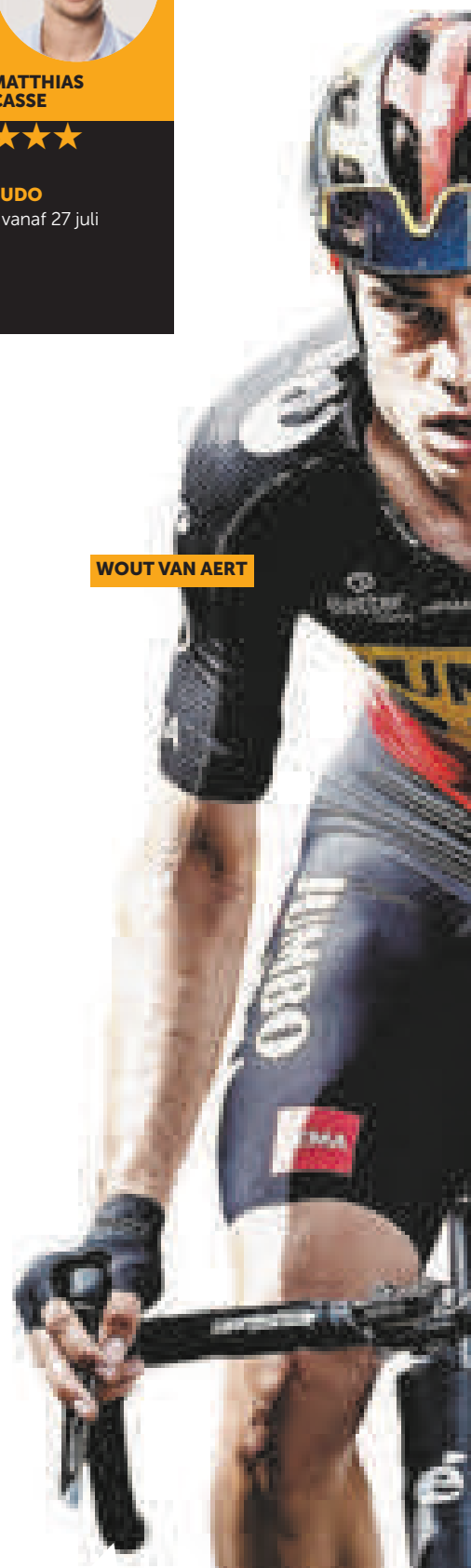
WOUT VAN AERT

Het is geen vergelijking, maar toch: de Rode Duivels, halve finalisten op de laatste World Cup, en kwartfinalisten in Europa, reden voor het voorbije EK onder politiebegeleiding met de bus