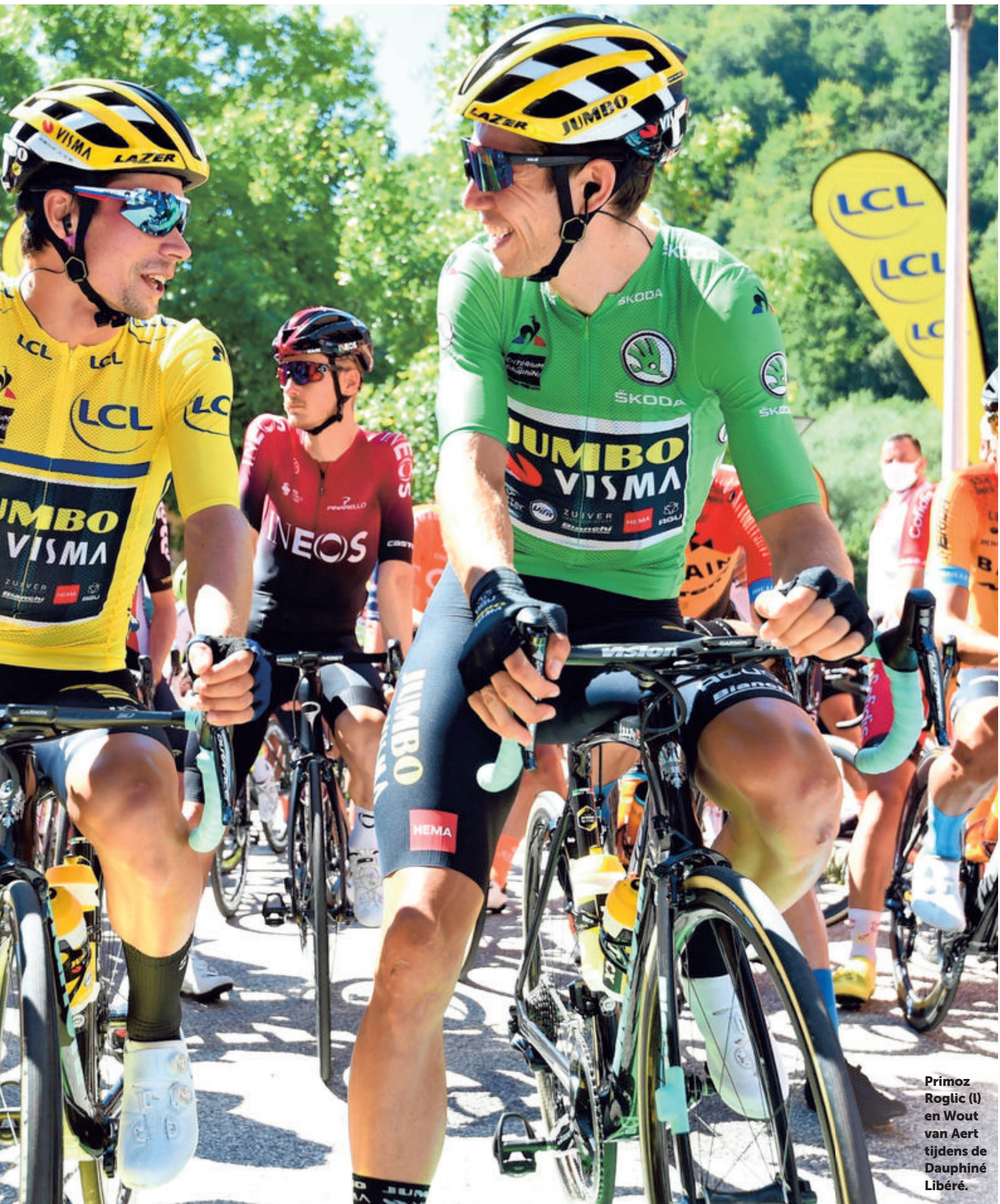
Primoz Roglic (l) en Wout van Aert tijdens de Dauphiné Libéré.