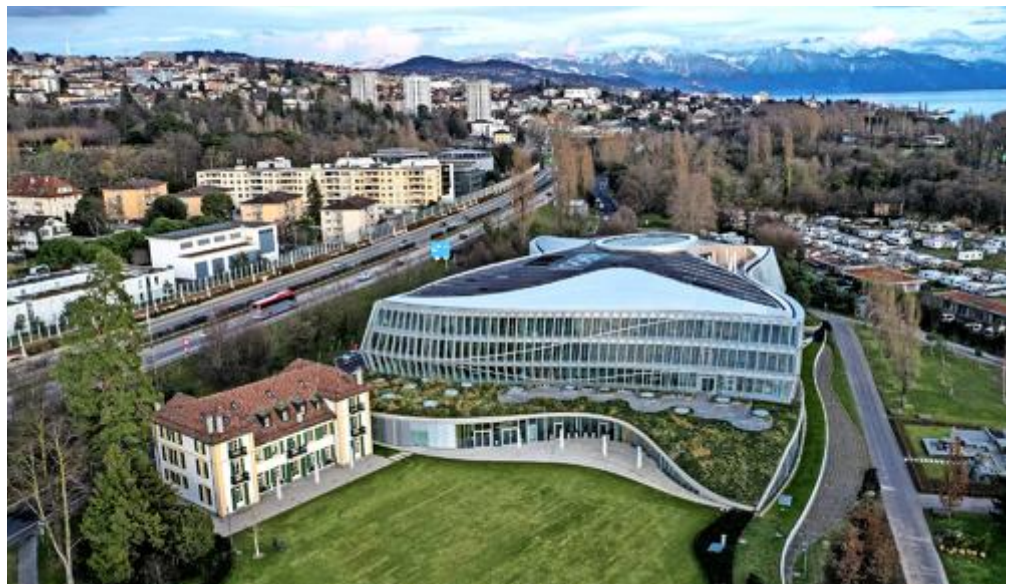
Het majestueuze hoofdkwartier van het Internationaal Olympisch Comité in Lausanne, waar voorzitter Thomas Bach kantoor houdt.